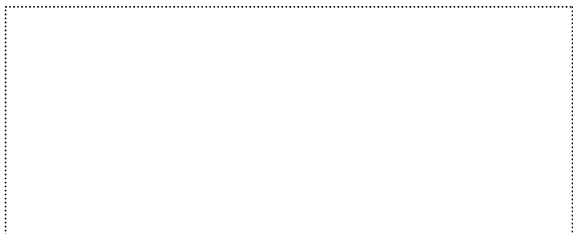
TIMBRO LINEARE DELLA SOCIETÀ RICHIEDENTE

LEGGERE LE NOTE IN CALCE PRIMA DI COMPILARE LA RICHIESTA