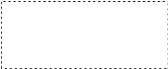
TIMBRO LINEARE DELLA SOCIETÀ RICHIEDENTE

Spett.le F.I.G.C. – L.N.D. Comitato Regionale Lazio Via Tiburtina, 1072 00156 ROMA